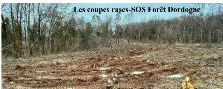
Les coupes rases-SOS Forêt Dordogne

Des forêts moissonnées comme des champs de blé. Des machines qui arrachent, coupent et débitent un arbre en moins d'une minute. Des hectares entiers dévastés, la surface scalpée de toute végétation, creusée par des ornières béantes à même l'humus. Ces scènes ne se déroulent pas à l'autre bout du monde mais au cœur des massifs français, dans le Morvan, dans le Limousin, dans les Landes. Et aujourd'hui, chez nous en Périgord. En cause ?