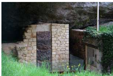
Abri du Moustier

Les sites préhistoriques et grottes ornées de la Vallée de la Vézère (France, Nouvelle Aquitaine, Dordogne) ont été inscrits en 1979 sur la Liste du Patrimoine mondial, parmi les premiers Biens dont la valeur universelle exceptionnelle a été reconnue par l'UNESCO.