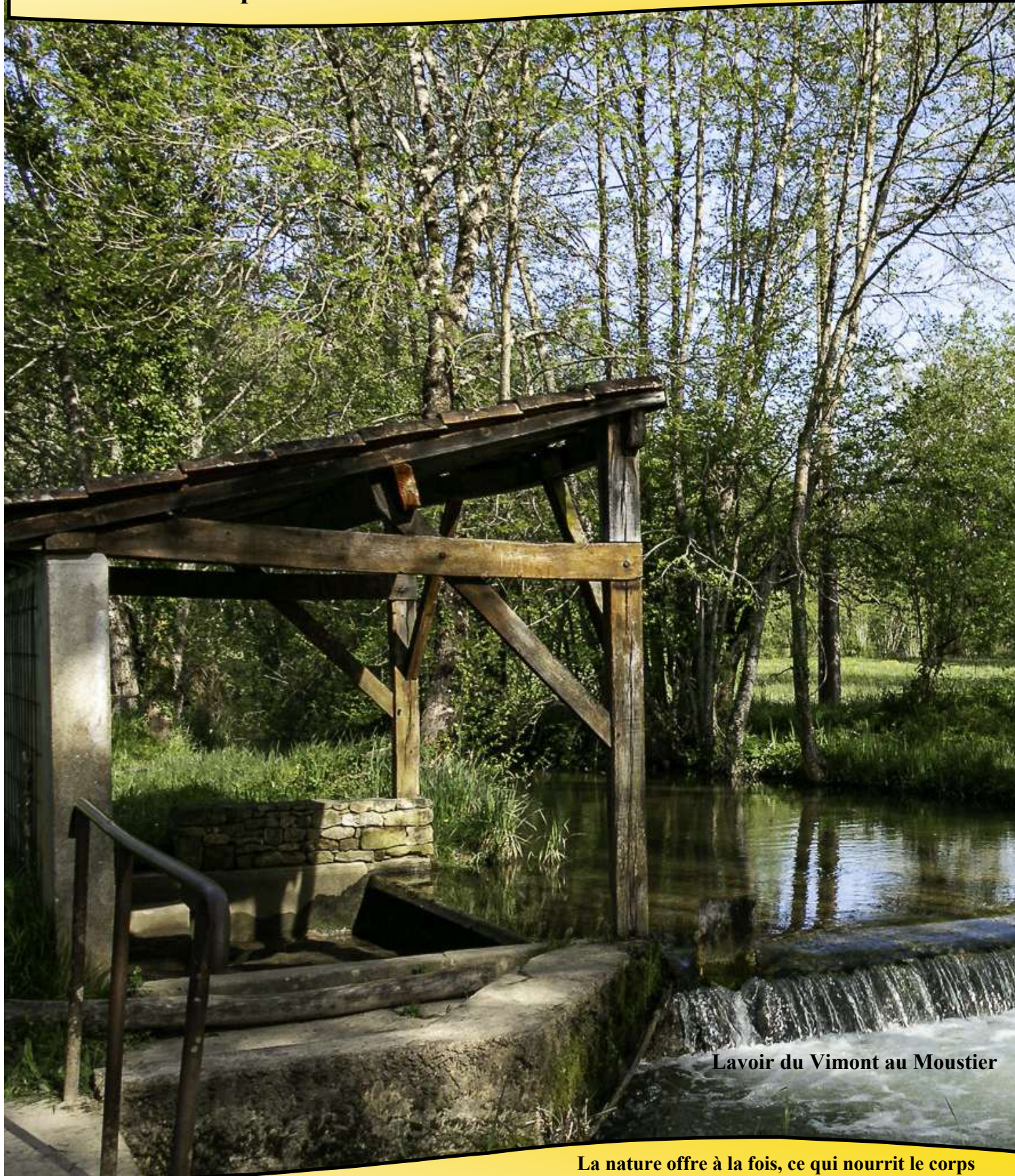
Lavoir du Vimont au Moustier

Flash Info n°4 - Septembre-Octobre-Novembre 2024